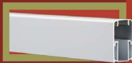
MAIN COURANTE No 0 HANDRAIL 1-1/2" x 3"