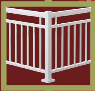
Disponible en double traverse Available as double rail